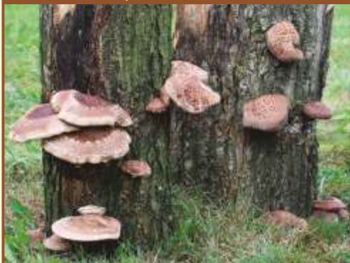
Shiitakepilz am Eichenstamm